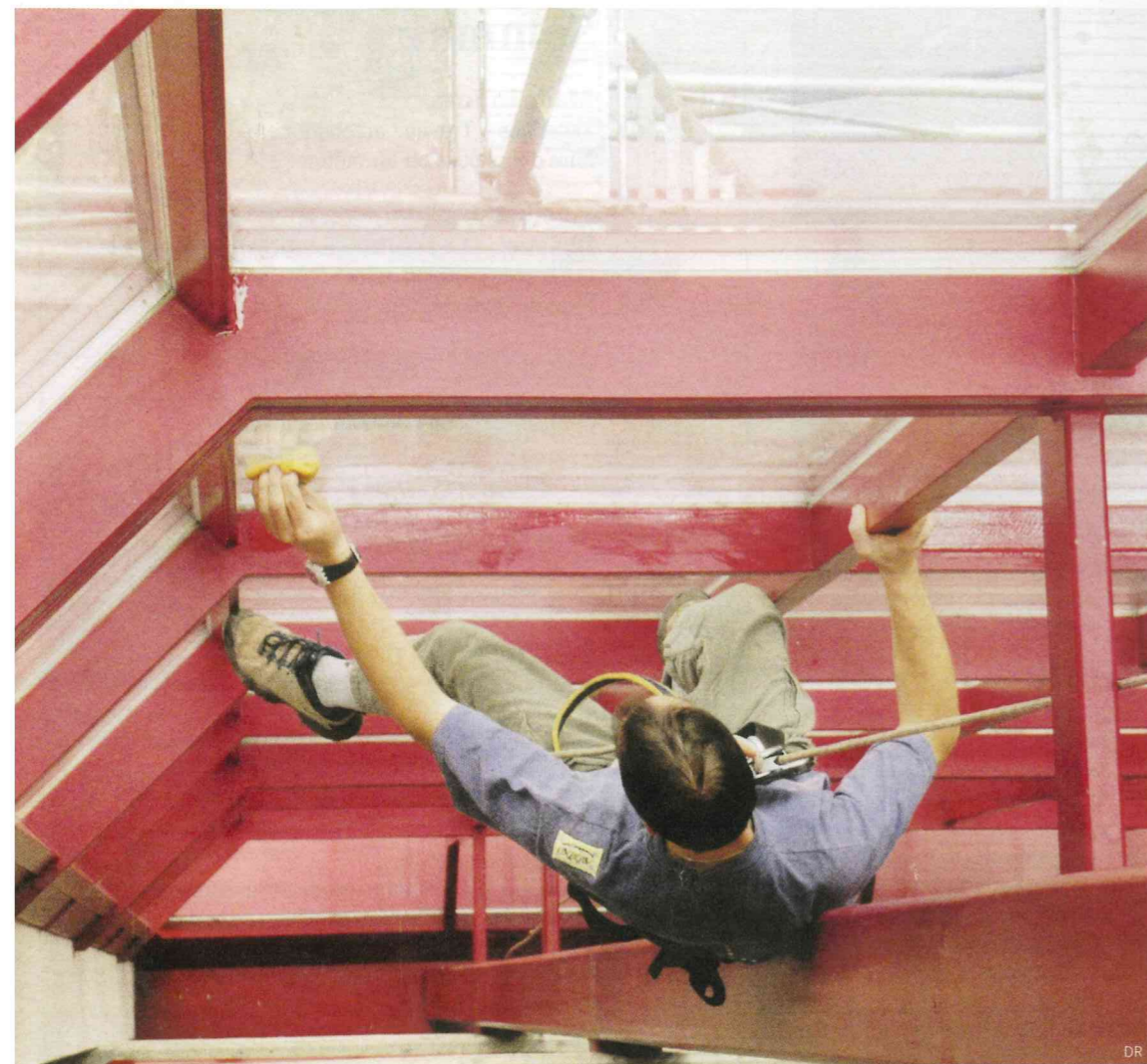
Nettoyage des vitres d'une entreprise.