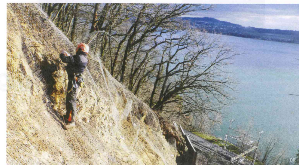
Stabilisation d'un terrain suite à un glissement.

Autre spécialité de cette entreprise polyvalente, le carottage permet d'ouvrir des passages à travers les murs ou les dalles les plus épais. « Dans des bâtiments existants, ces travaux de perçage servent pour le passage de gaines techniques, l'installation d'une ventilation ou d'une climatisation », précise Damien Linder. Enfin, la thermographie en bâtiment ou industrielle relève aussi de la compétence d'Abat Tech. Pour un bien immobilier, cette technique d'imagerie infrarouge permet de vérifier la qualité de l'isolation et de la renforcer là où c'est nécessaire. PF