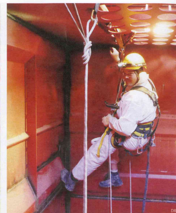
Le baudrier, le casque et les cordes sont les outils de sécurité quotidiens du travailleur acrobatique.